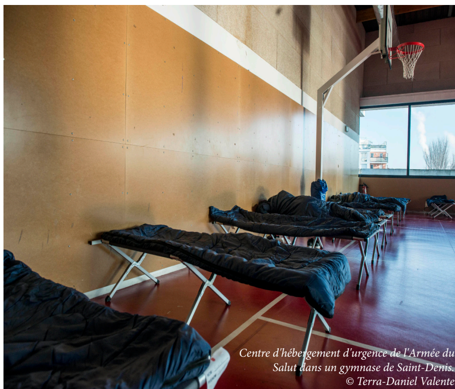
Centre d'hébergement d'urgence de l'Armée du Salut dans un gymnase de Saint-Denis.

Elle s'est déroulée la nuit du 3 au 4 mars 2016 et s'adressait à l'ensemble des structures ouvertes à cette période. Son objectif est d'améliorer la connaissance de la typologie des publics accueillis et de suivre son évolution au fil des années.